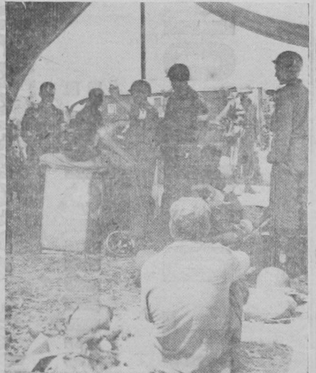
Un hospital de sangre del ejército de los Estados Unidos en Sicilia. En estos hospitales se atiende a los heridos tan pronto se les recoge en el campo de batalla. Los oficiales que se ven en la foto están a punto de administrar seroplasma a un soldado herido.