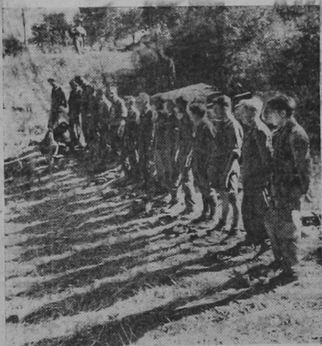
Aquí se ven soldados nazis que se rindieron a los estadounidenses en Sicilia en el momento de someterse al registro corriente antes de ser enviados a los campamentos de retaguardia. Las sombras que proyectan son un presagio de la suerte que espera a sus compañeros de armas.