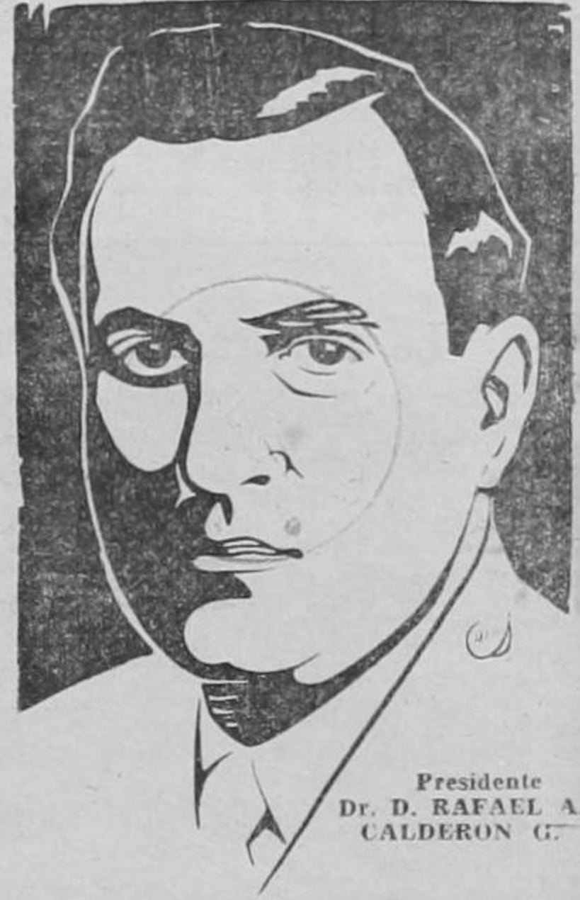
Presidente Dr. D. RAFAEL A. CALDERON G.

DIJO QUE HABIA LLEGADO A PUNTARENAS INVITADO POR LOS TRABAJADORES DE ESE PUERTO Y QUE CORRESPONDIALES Y LES AGRADECIA CON SU PRESENCIA ESE CORDIAL HOMENAJE. ::: AGREGO QUE EN LA MISMA FORMA VISITARIA TODA LA REPUBLICA EN DEFENSA DE SUS REFORMAS SOCIALES. ::: PROMETIO CONTINUAR LA DISTRIBUCION DE TIERRAS A LOS CAMPESINOS PORQUE CONSIDERABA QUE LA TIERRA ERA LA QUE, EN VERDAD GENERABA LAS LIBERTADES AL DAR BIENESTAR ECONOMICO QUIENES LA POSEIAN